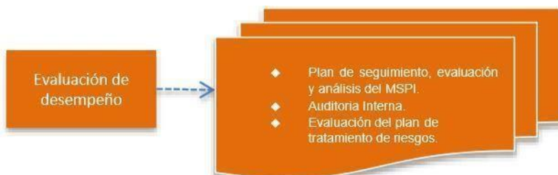
Figura 5. Fase Evaluación Desempeño modelo de seguridad

Evaluar el desempeño y la eficacia del SGSI, a través de instrumentos que