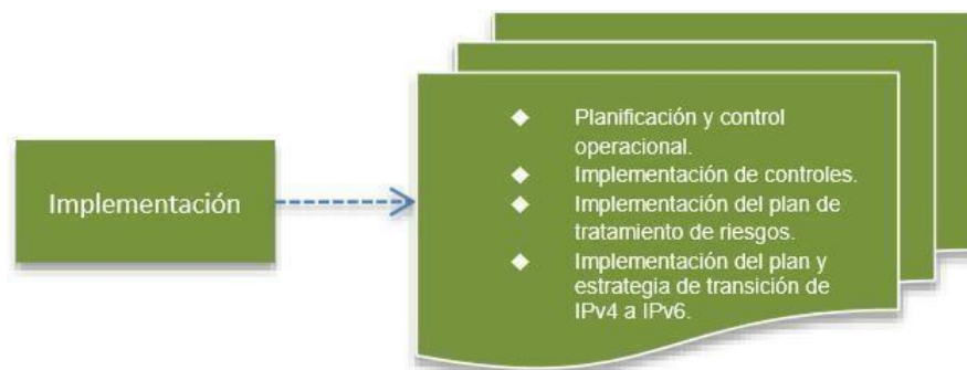
Figura 4. Fase de implementación modelo de seguridad

Llevar a cabo la implementación de la fase de planificación del SGSI, teniendo en cuenta para esto los aspectos más relevantes en los de implementación del Sistema de Gestión de Seguridad