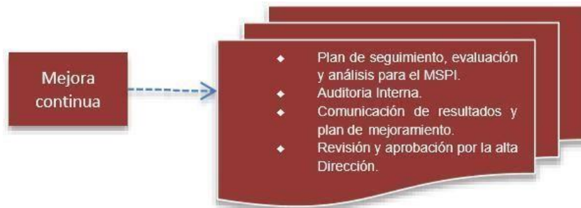
Figura 6. Fase Mejora Continua modelo de seguridad

Consolidar los resultados obtenidos del componente de evaluación de desempeño, para diseñar el plan de mejoramiento y privacidad de la información, que permita realizar el plan de