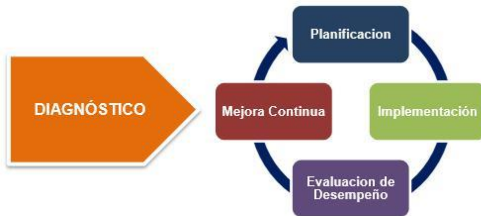
Figura 1. Ciclo de operación Modelo de Seguridad y Privacidad de la Información

El Modelo de Seguridad y Privacidad de la Información de la Estrategia de Gobierno en Línea contempla el siguiente ciclo de operación que contempla cinco (5) fases, las cuales permiten que las entidades puedan gestionar adecuadamente la seguridad y privacidad de sus activos de información 1 .