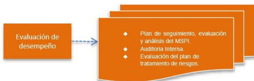
Figura 5. Fase Evaluación Desempeño modelo de seguridad