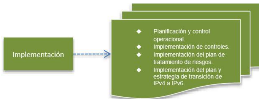
Figura 4. Fase de implementación modelo de seguridad