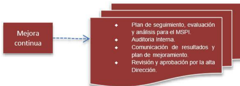
Figura 6. Fase Mejora Continua modelo de seguridad